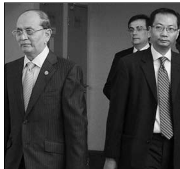
وقال من المرجح جدا ان نتوصل الى وقف لاطلاق النار على الصعيد الوطني وان نحمد فوهات البنادق في بورما للمرة الاولى منذ 60 عاما.

اعلن الرئيس البورمي ثين سين في لندن ان جميع السجناء السياسيين في بلاده سيتم الافراج عنهم قبل نهاية العام، مضيفا انه في الاسابيع المقبلة قد يتم التوصل الى وقف لاطلاق النار بين القوات الحكومية ومختلف المجموعات الاثنية المتمرة. وقال الرئيس امام الحضور في تشام هاوس ، مجموعة الابحاث العرقية في لندن، اضمن لكم انه بحلول نهاية هذه السنة لن