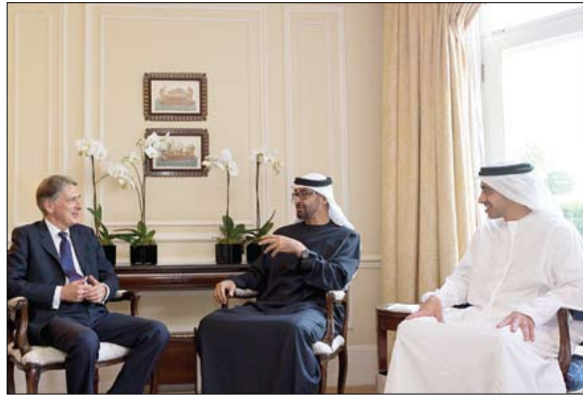
محمد بن زايد خلال لقائه وزير الدولة لشؤون الدفاع البريطاني بحضور عبد الله بن زايد

تنفيذا لتوجيهات رئيس الدولة الهلال الأحمر تطلق اليوم حملة مصر في قلوبنا •• أبوظبي-وام: تنفيذا لتوجيهات صاحب السمو الشيخ خليفة بن زايد آل نهيان رئيس الدولة حفظه الله تطلق هيئة الهلال الأحمر حملة مصر في قلوبنا لدعم ومساعدة الشعب المصري الشقيق والوقوف الى جانبه في الظروف الاقتصادية الصعبة التي يواجهها. وأكد سمو الشيخ حمدان بن زايد آل نهيان ممثل الحاكم في المنطقة الغربية رئيس هيئة الهلال الأحمر أن توجيهات صاحب السمو رئيس الدولة تجسد عمق العلاقات الأخوية بين الشعبين الإماراتي والمصري. وقال سموه ان هيئة الهلال الأحمر وضعت خطة طموحة للتحرك الفوري على الساحة المصرية بالتعاون والتنسيق مع شركائنا في الهلال الأحمر المصري. مشيراً إلى أن الحملة تستهدف كافة قطاعات الشعب المصري. وأوضح سموه ان الشعب المصري ظل على الدوام بجانب أشقائه العرب في محنهم وأزماتهم ولم يتأخر يوماً في تلبية نداءات الواجب الإنساني لجيرانه والإنسانية جمعاء لذلك كان لزاماً علينا الوقوف بجانبه في هذه الظروف الطارئة التي يمر بها. حملة محمد بن راشد لكسوة مليون طفل محروم حول العالم نتيج يجمع تبرعات لكسوة 492.301 ألف طفل •• دبي-وام: نجحت حملة محمد بن راشد آل مكتوم لكسوة مليون طفل محروم حول العالم وبعد 5 أيام فقط من الإعلان عن إطلاقها في جمع تبرعات لكسوة 492.301 ألف طفل محروم حول العالم أي ما يقارب نصف عدد الأطفال الذي تطمح الحملة لكسوتهم مع انتهاء فترة الحملة في 19 رمضان والذي يوافق يوم العمل الإنساني الإماراتي. (التفاصيل ص2)