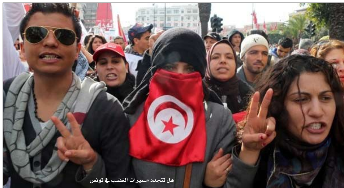
هل تتجدد مسيرات الغضب في تونس

واتهم الخصوصي الأغلبية داخل المجلس التأسيسي بتعمد تعطيل عمل المجلس لتمتكن من إدارة شؤونها ومناصم المجتمع لتجتم بالتالي على صدره وتشمل حركته وتسلبه إدارته بغاية تأسيس نظام شمولي على حد تعبيره.