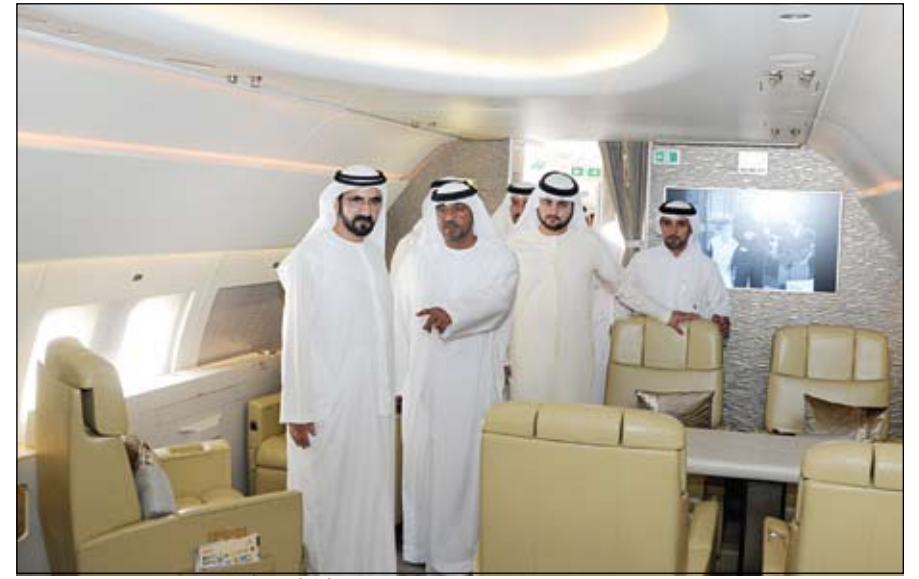
محمد بن راشد خلال تفقده طائرة الأيرباص 319

•• لندن-وام: زايد آل نهيان وزير الخارجية العلاقات الثنائية القائمة بين دولة الامارات العربية المتحدة والمملكة المتحدة وسبل تعزيزها وتطويرها بما يخدم مصالح البلدين والشعبين الصديقين. كما جرى خلال اللقاء بحث آفاق التعاون بين البلدين خاصة فيما يتعلق بالشؤون العسكرية والدفاعية. وتناول اللقاء الذي حضره سمو الشيخ عبدالله بن