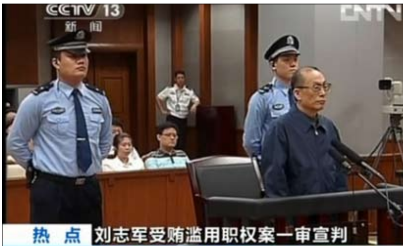
البيان: 刘志军受贿滥用职权案一审宣判

الإنسان لاجتماع الجمعة الماضي في مطار شيريمييتيفو بموسكو أنه ما أن أصبح سنودن في الجو، حتى أصبح ذلك معروفا، وقد منعه الأميركيون من أخذ أي رحلة أخرى. وتابع لقد أخافوا جميع الدول الأخرى، بحيث لم يعد أحد راغبا في استقباله، وبالتالي جعلوه محتجزا في أراضينا، حسيما نقلت عنه وكالات الأنباء. وردا على سؤال بشأن ما سيحدث لسنودن في المستقبل، قال بوتين إن الأمر يتعلق به، مشيرا إلى هذا الصدد إلى تغير في موقف سنودن الذي قال الجمعة إنه يرغب في التقدم بطلب لجوء في روسيا والحصول على وثائق قبل أن يتوجه إلى أميركا اللاتينية. غير أن بوتين امتنع عن الإفصاح عما إذا كان سيمنع سنودن اللجوء أو متى يمكن أن يحصل ذلك وكان بوتين صرح في وقت سابق من هذا الشهر بأن سنودن يمكنه طلب اللجوء في روسيا في حال توقف عن تسريب أي معلومات جديدة. ودفع ذلك سنودن إلى سحب طلب اللجوء، غير أن نشطاء حقوقيين قالوا عقب لقائهم سنودن الجمعة إنه وعد بعدم الإضرار بمصالح الولايات المتحدة مستقبلا وذكرته دانرة الهجرة الفدرالية في روسيا أنها لم تلتزم طلب لجوء من سنودن حتى الآن.